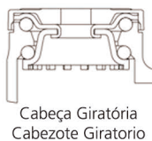
Cabeça Giratória Cabezote Giratorio