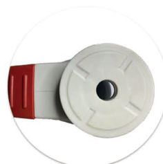
Furo de Fixação Agujero para Fijación