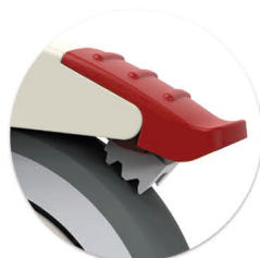
Freio Total Freno Total