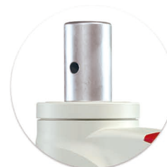
Haste Sólida Haste Solida