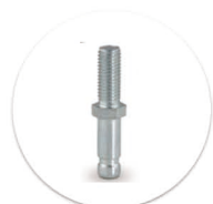
Pino Giratório com Rosca Passador giratória con rosca