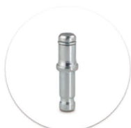
Pino Giratório com Anel de Retenção Passador giratório con anillo de retención