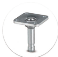
Pino Giratório com Placa Passador giratório con placa