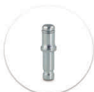
Pino Giratório com Anel de Retenção Passador giratório con anillo de retención