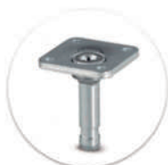
Pino Giratório com Placa Passador giratório con placa