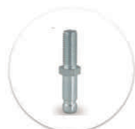
Pino Giratório com Rosca Passador giratória con rosca