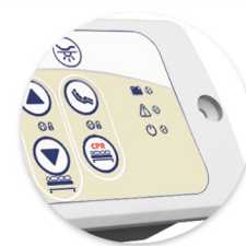
Membrana Personalizada Membrana Personalizada