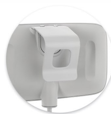
Gancho do Supervisor Gancho del Supervisor