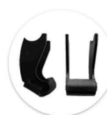
Alavanca de acionamento Leva de accionamiento

Comandos manuais devem ser adquiridos separadamente. Ver página 20. Mandos deben de ser adquiridos por separado. Mirar pagina 20.