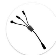
Cabo X p/ 3º atuador Cable X p/ 3º actuador

Eixos: Ø 25 mm Espessura mínima: 3,0 mm Distância entre eixos: 581 ± 2 mm