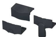
KS3 Pés Articulados KS3 Pies Articulados